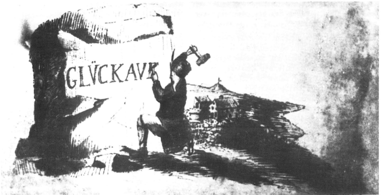
Abb. 4: Federzeichnung auf Pergament von Johann Christian Duckwitz, Dresden, 18. August 1773

der Geistesbewegung der Aufklärung Ausdruck verleiht. Die Stelle findet sich in „Wilhelm Meisters Wanderjahren“, die durch die Gestalt des Jarno Montanus mancherlei Bezüge zur bergbaulichen Welt haben. Da heißt es: „Montan geleitete seinen Freund . . . in dem Bergrevier methodisch umher, überall begrüßt von einem derben Glück auf!, welches sie heiter zurückgaben. Ich möchte wohl, sagte Montan, ihnen manchmal zurufen: Sinn auf!, denn Sinn ist mehr als Glück . . . Das Glück tut's nicht allein, sondern der Sinn, der das Glück herbeiruft, um es zu regeln“ 36 . Eine kennzeichnende Interpretation, die beispielhaft die tiefgreifende Wandlung von der religiösen zur kritischen Epoche beleuchtet; sie deutet auf den Anbruch eines Zeitalters hin, das von den Kräften der Ratio, des Verstandes, beherrscht wird. Der kritische Verstand begründet ein wissenschaftlich orientiertes Weltverständnis und damit eine Daseinsgestaltung, aus der heraus auch die industriellen Initiativen und Aktivitäten voll zum Zuge kommen.